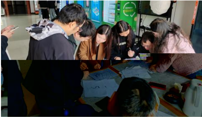
图 卓越团队建设共识营