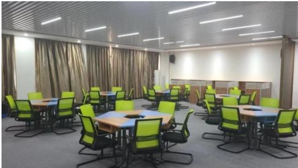
图 智慧零售运营中心