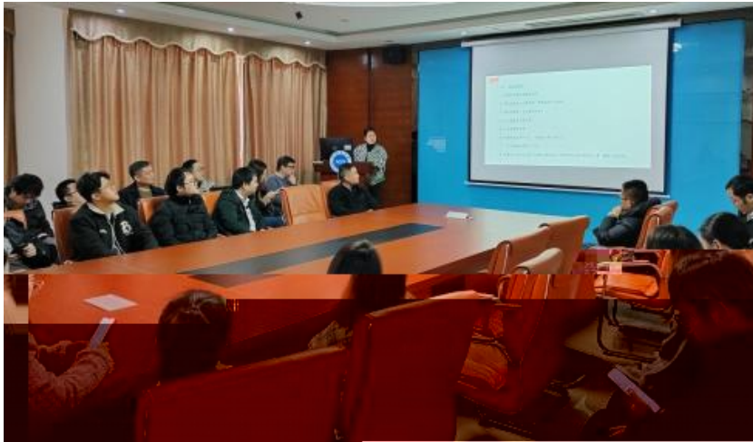
图 员工专业技能培训

，公 促 发 和 才 方 得 成 。 过 创 的 和 ， 不 动 公 的 持 成长， 工 供 的发 机会。 过 供多 化的 和发 ， “ 队 共 ” 等 活动 ( )， 帮 工 ( 技 和管 ； 并 的 和 规划， 工的 合 和 ， 包 导 发 计划、技 技 及 部 等， 地促 工的 方 发 。