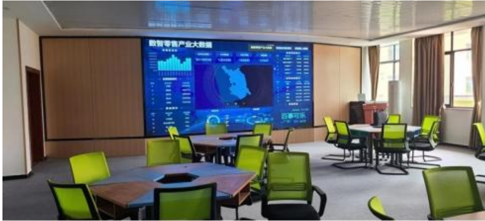
图 智慧零售运营中心