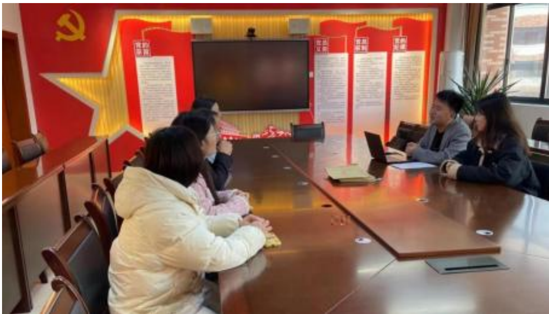
图 校企开展学术研讨项目交流会议

公 高度 队 的 ，充分 到 和 的关 ，对 高 和 关 的 。此公 供 ，包 更 、 方法 及 导 发 程，并 持 丰富 的 家 过 、 会 和 际案 ， 队 分 的 和 。 常 地 活动， 包 参加 会 、 等 ， 促 问 的 分 ， ， 并 的 队 ( )。